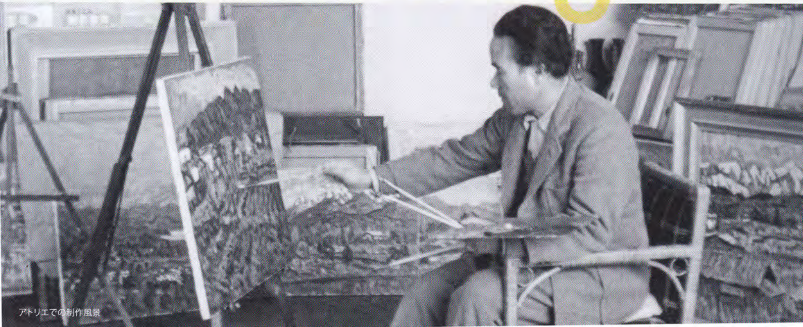
アトリエでの制作風景