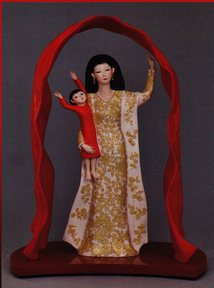
令和に明けゆく[人形] 奥田小由女 (日展理事長)