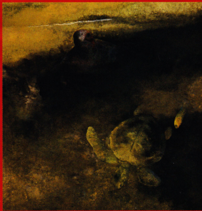
海の哲人 土屋禮一(日展副理事長)