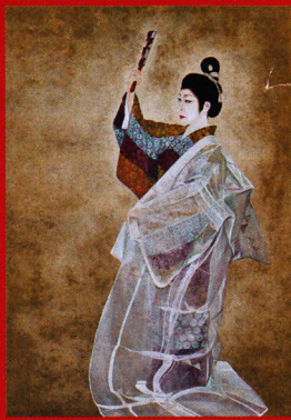
古道成寺 福田千恵(日展理事・審査員)